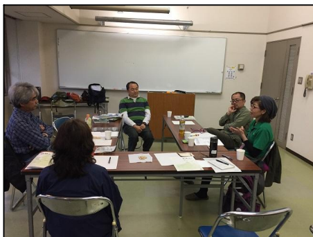
午後は研修室で、「わかちあい」について討論。