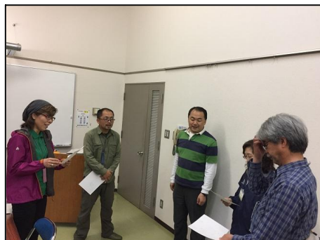
最後に、フローリング第4段階のアクティビティ「森の設計図」を体験。