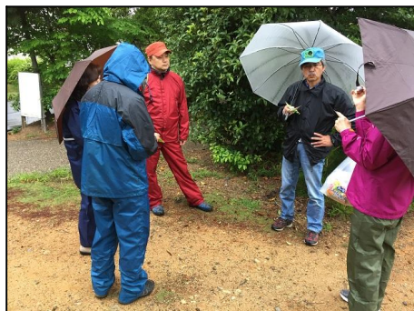
新しいアクティビティ、「音日記」を体験。