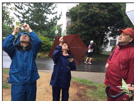
葉っぱを空にかざすと、様々な模様があり、驚きました。