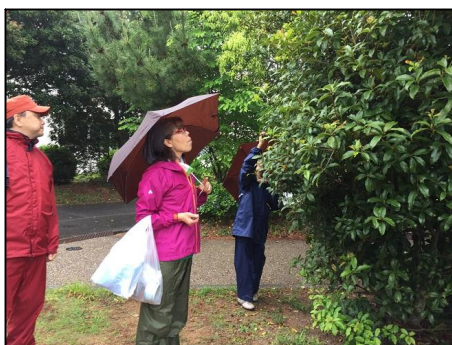
まず最初は公園の木の葉を観察。